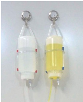
PBSと固定液の2液が使用できます。